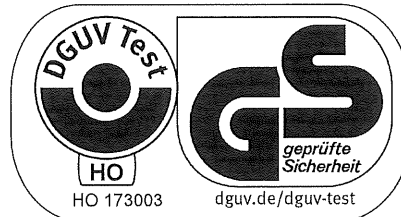
Bei einer Höhe von 20 mm oder weniger ebenfalls zulässige Ausführung